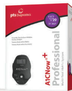
A1CNow®+ system (20-count test kit) 3021