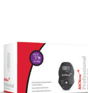
A1CNow®+ system (10-count test kit) 3024